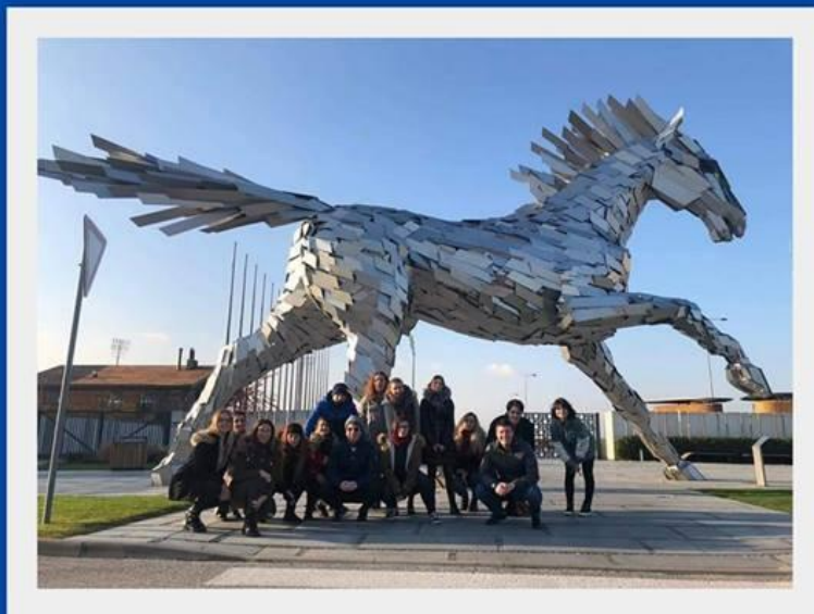
Projektové stretnutie na SĽA a SSOŠ SD Jednota Šamorín